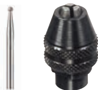
diamantna konica 7103 in vpenjalna stročnica