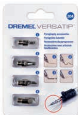
set pribora za vžiganje v les