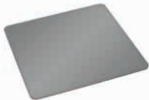
podloga za lepljenje