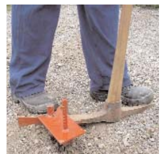
leicht zu entfernen

+ Die Schrägstütze wird einfach mit einer Sechskant- mutter am Stütznagel befestigt.