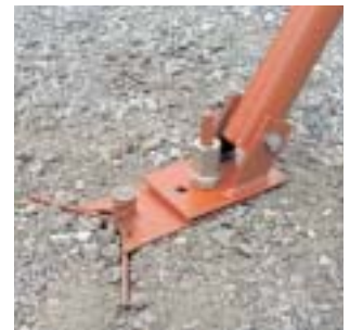
einfaches fixieren der Schrägstütze

+ Wiederverwendbarer Schalungsstütznagel zum Verankern Ihrer Schrägstützen auch im lockeren Erdreich.