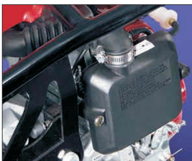
Kvaliteten dvojni čistilec zraka.