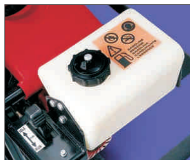
Prozoren plastični rezervoar za boljšo preglednost stanja goriva.