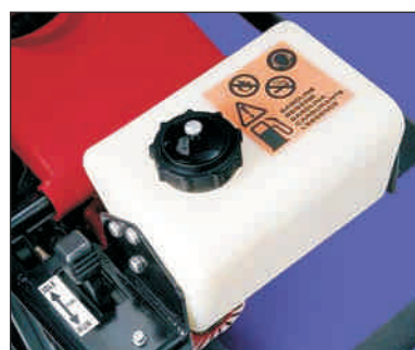
Prozoren plastični rezervoar za boljšo preglednost stanja goriva.