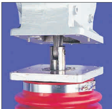
Modularna zasnova stroja omogoča hitro servisiranje.