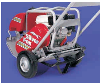
Možnost transportnih koles.