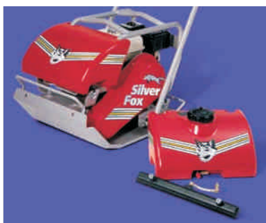
Enostavno snemljiv rezervoar za vodo.